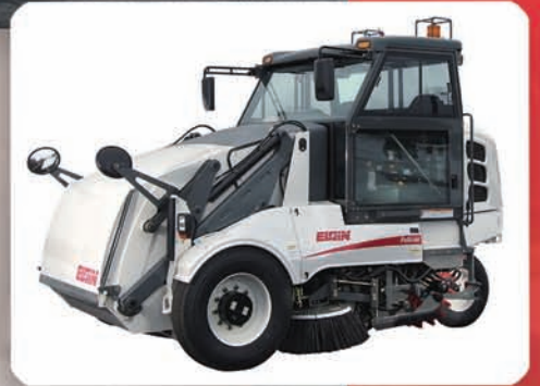
Modelo P — Hidráulico