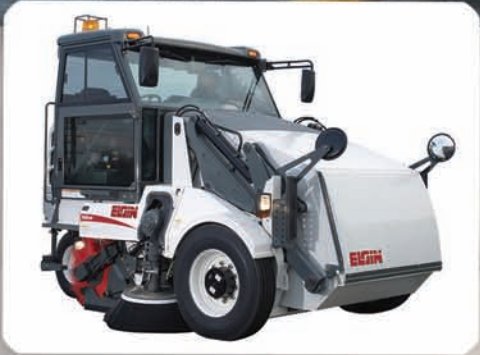
Modelo S — Mecánico