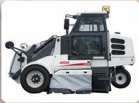
Modelo PW — Hidráulico sin agua